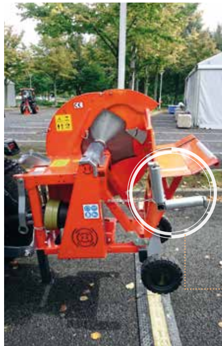
Support de bûche intégré