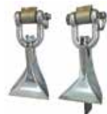
Couteaux < palettes pour PANTHER