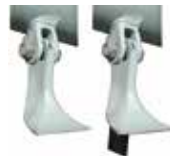
Couteaux < palettes pour KOALA