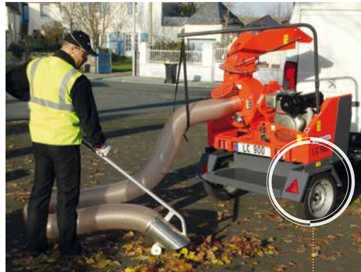
sur châssis routier