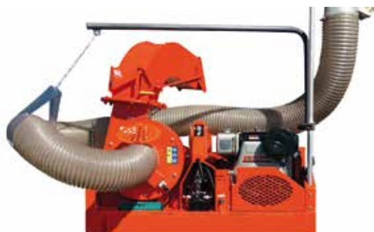
Modèle LC900 ECO

sur ridelle avec chaise hydraulique autoporteuse