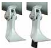
Couteaux < palettes pour KOALA